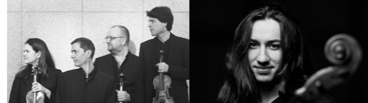
12:20 - 13:00 Ensemble Malibran Triomphe de Ré Majeur