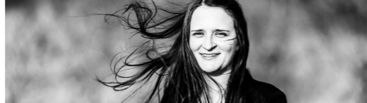
11:45 - 12:20 J. Brahms Sonata & G. Mahler Piano quartet