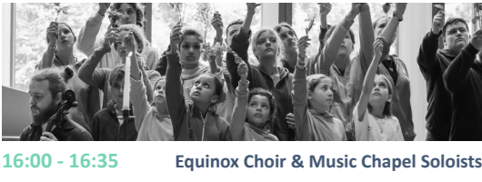
16:00 - 16:35 Equinox Choir & Music Chapel Soloists