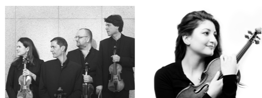
17:00 - 17:45 Ensemble Malibran Nordic Lights