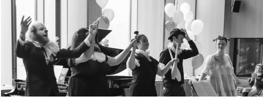
12:00 - 12:45 Opéra en Folie