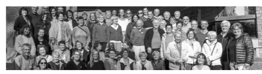
15:45 - 16:15 Chorale La Chantanne