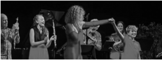
13:30 - 14:15 Pierre et le loup & Disney Classics