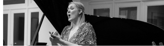
13:00 - 13:35 Cabaret Songs