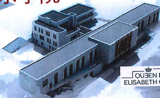
QUEEN MUSIC ELISABETH CHAPEL