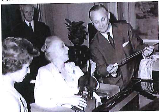
伊丽莎白王后热衷于音乐

2014年，伊丽莎白王后音乐学院将通过一系列大型乐团和独奏音乐会来庆祝学院成立75周年。为吸引年轻群体的关注，社交网络上发布的音乐会信息掀起了交流浪潮。